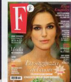
Keira Knightley

44 Spiritualità. Se non la coltivi ogni giorno rischi di perderla. Per sempre