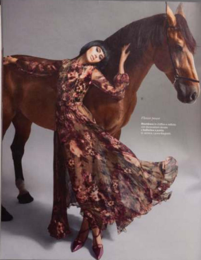
Flower power Modellata in cotone e seta con decorazioni in seta e bollicine a piume di seta. L'aria è dolce.